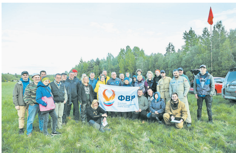
Соревнования собрали участников из Петербурга, Пскова, Московской и Ленинградской областей