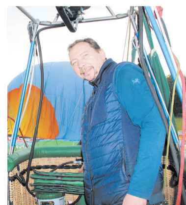
Вячеслав Ананских, глава Федерации воздухоплавательного спорта

Ну а ваша покорная слуга стала обладателем титула «графини Кривко» — по традиции человека, впервые совершившего полёт на воздушном шаре, посвящают в воздухоплаватели и присваи-