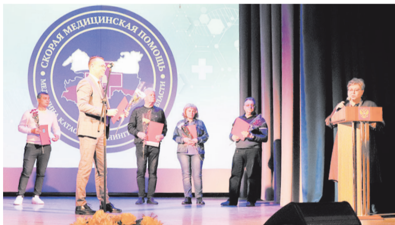
День работника скорой помощи стал официальным праздником в 2020 году