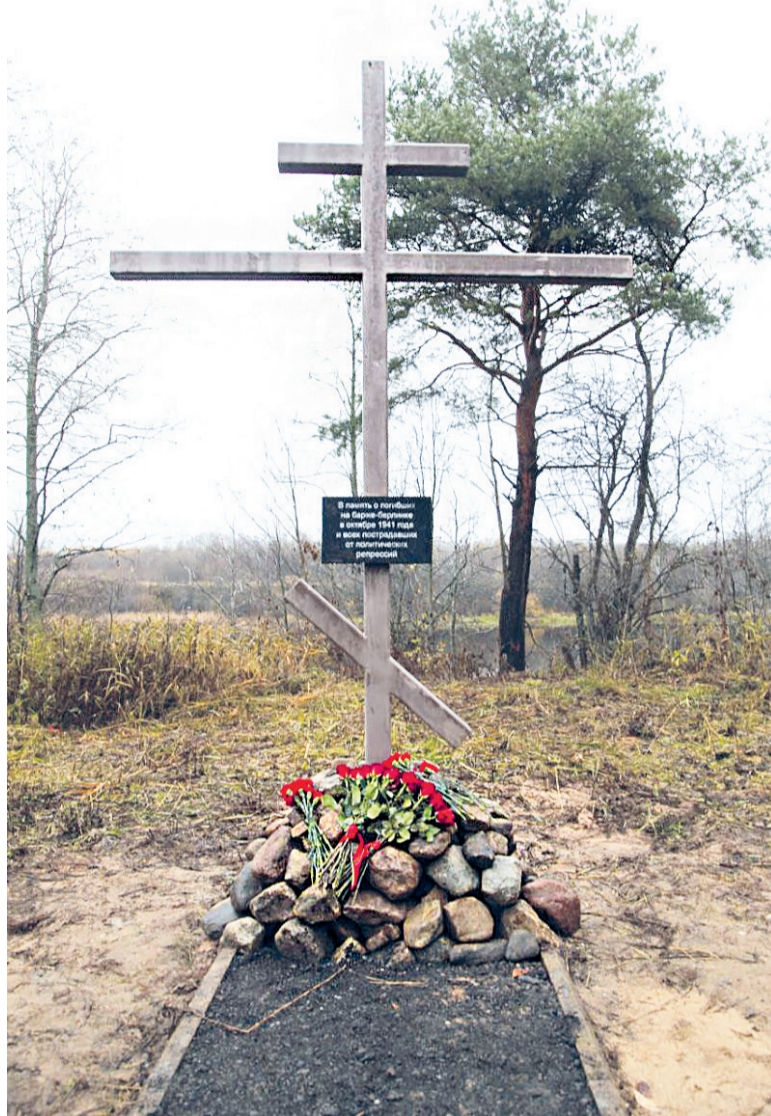
Поклонный крест, установленный в октябре 2022 г. у деревни Судемье в Сясьстройском поселении