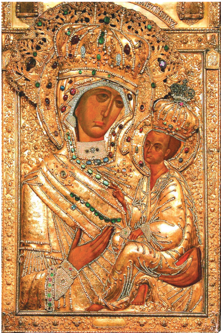
9 июля Православная церковь отмечает праздник Тихвинской иконы Пресвятой Богородицы. Эта икона – один из самых древних почитаемых православной церковью образов.

Согласно преданию, он был написан евангелистом Лукой еще при земной жизни Богородицы. Лик Богородицы много раз вдохновлял и поражал верующих людей чудодейственными знаменами и свойствами. Предание рассказывает, что икона в Тихвине появилась в 1383 году. После взятия Константинополя турецкими войсками икона нашла новый удел – Святую Русь. Лик святой девы шествовал по селениям на руках ангелов и предстал перед взором восторженного населения. Своё шествие она остановила на берегу тихой реки Тихвинка. Благодарные жители построили деревянный храм Успения Богородицы, где этот святой образ