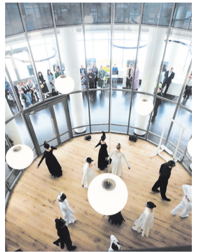
Выступление студентов областного колледжа искусств

— Важный посыл фестиваля — не просто говорить о Набокове, но и о том, как его наследие можно изучать и показывать в музеях. Отсюда — проектные лаборатории и семинары. Как литературный текст превратить в экспозицию, как под-