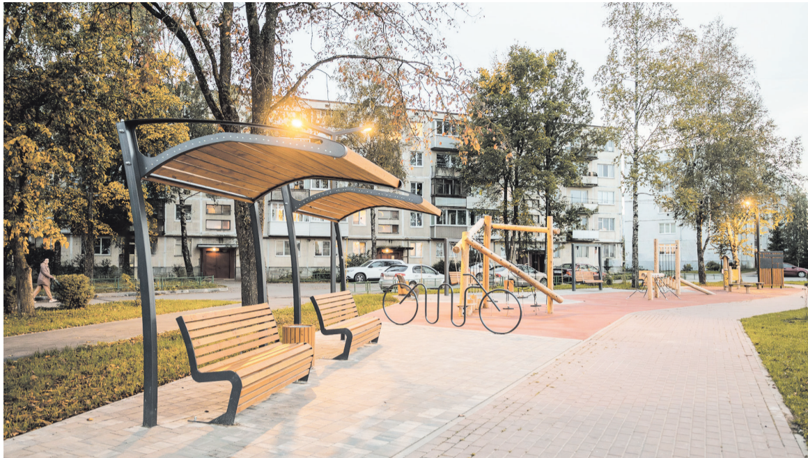
Общественное пространство в Пудомьягах вошло в список лучших объектов благоустройства Минстроя РФ

— Встречаемся и общаемся с жителями небольших населённых пунктов, где в 2025 году по президентскому нацпроекту «Жильё и городская среда» планируется благоустройство общественных территорий. Сначала