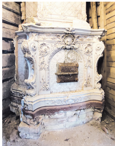
Старинный камин в усадьбе Киискиля