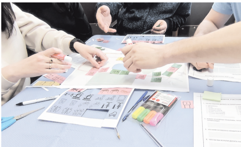
На проектировочной сессии жители посёлка могли выбрать наполнение проекта благоустройства

КСЕНИЯ БОНДАРЕНКО ФОТО АВТОРА, ЦЕНТРА КОМПЕТЕНЦИЙ ЛО