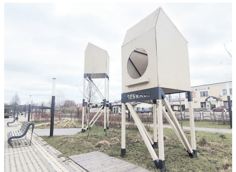
Птичья площадь в посёлке Лебяжье

В планах на 2025 год — благоустройство водоёма и сквера на улице Приморской. Туристам эти места знакомы по расположению неподалёку штурмовику Ил-2 — памятнику «Защитникам ленинградского неба». Да и та самая Птичья площадь находится совсем рядом. Так что