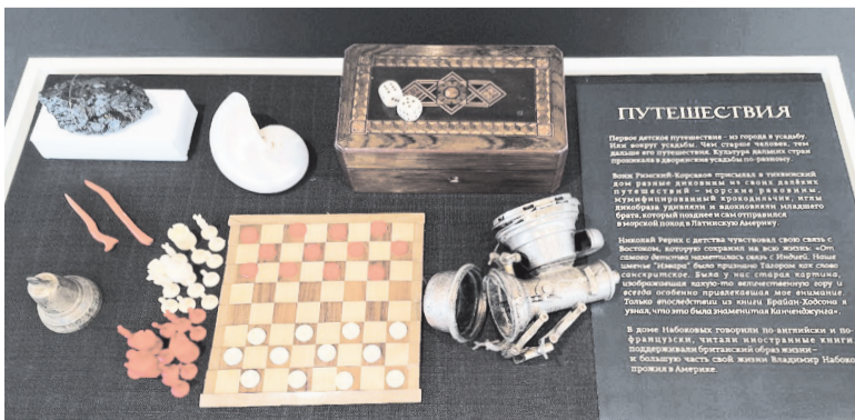
Дорожный набор путешественника начала XX века

Забавно рассматривать метафорические ландшафты усадеб, в которых выросли гении русской культуры. Это не точные макеты имений, а видение художника, рождённое после прочтения писем, воспоминаний, биографического набоковского романа «Другие берега».