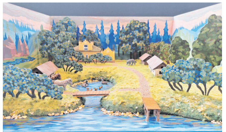
Усадебное детство связывает судьбы Набокова, Рериха и Римского-Корсакова