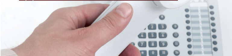
Обращение к жителям Волховского муниципального района

С 11 по 22 марта на территории Ленинградской области проводится первый этап Общероссийской антинаркотической акции «Сообщите, где торгуют смертью».