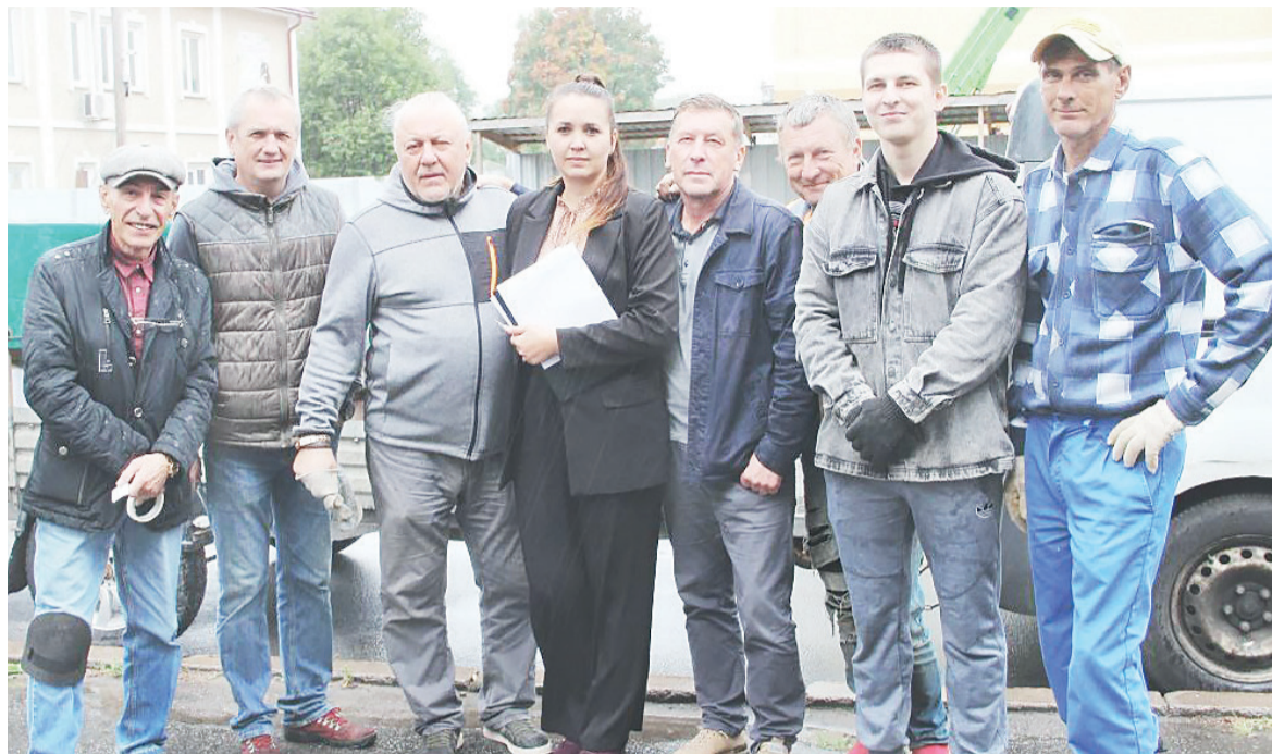
Команда добровольцев на погрузке гуманитарки Лодейное Поле 21.09.2023 г.

Ситуация в республике на военном положении откладывала сроки выезда, да ещё и вечная