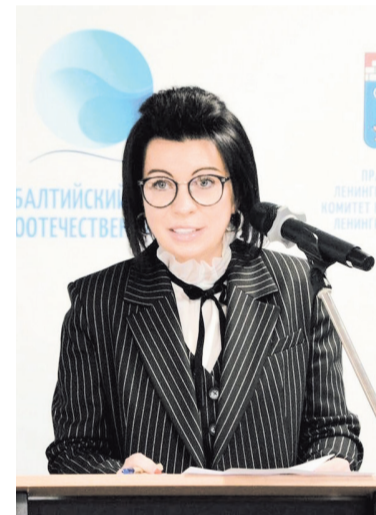
Анна Данилюк, вице-губернатор Ленобласти

— Да, Прибалтика прошла точку невозврата. Но нельзя сказать, что «окно в Европу» закрыто. Сегодняшняя антироссийская политика является частью «украинского проекта» Запада. Когда нам удастся поставить точку в этой истории, изменится и ситуация во всей