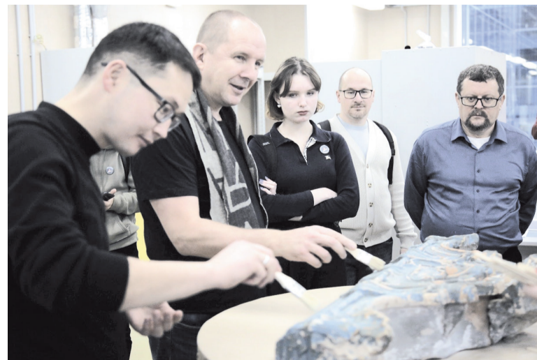
Участники форума посетили Международный центр реставрации в селе Рождествено

АЛЕКСЕЙ АСТАПЧИК ФОТО: АЛЕКСЕЙ АСТАПЧИК, МЕЖДУНАРОДНЫЙ РЕСТАВРАЦИОННЫЙ ЦЕНТР