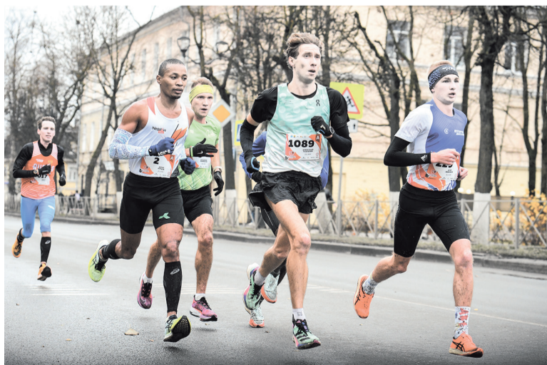
На старт вышли спортсмены из Беларуси, Украины, Казахстана, Израиля и Германии

МАРГАРИТА АЛЕКСЕЕВА ФОТО: ГАТЧИНСКИЙ ПОЛУМАРАФОН