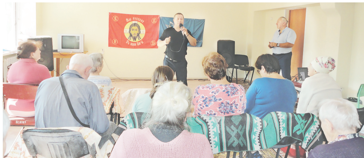
Концерт в Северодонецке в общежитии для бездомных и престарелых

программ нашей агитбригады. Логистика была непредсказуемой, и если вечером концерт был спланирован в подразделении «А», то утром мы уже направлялись в пункт «Б». Четыре дня наши самодеятельные артисты радовали бойцов и жителей Северодонецка, Металлиста и Луганска.