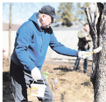
Акцию поддерживает руководство области

Например, в Тихвинском районе прошёл субботник на берегу Тихвинки рядом с биатлонным стрельбищем и зоной отдыха у воды. В уборке приняли участие сотрудники спортшколы «Бога-