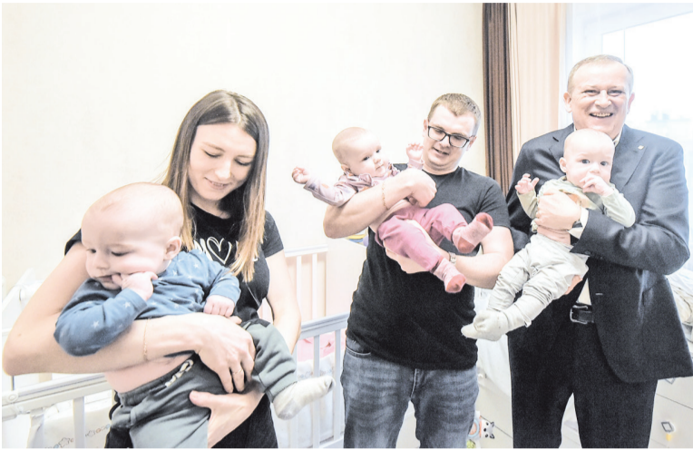
Александр Дрозденко на встрече с многодетными родителями