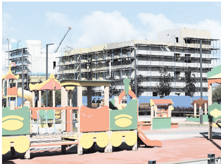
■ За 2023 год в Ленобласти сдали 25 социальных объектов

КСЕНИЯ БОНДАРЕНКО ФОТО АВТОРА, ПРЕСС-СЛУЖБЫ ПРАВИТЕЛЬСТВА ЛО