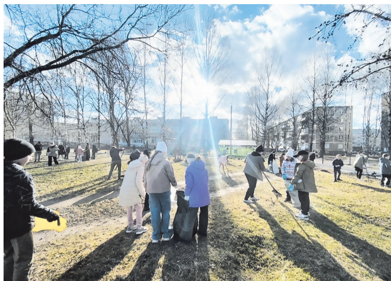
Ленинградцы вышли на первые субботники ещё до официального старта акции