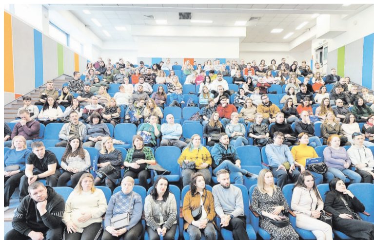
День открытых дверей в Перинатальном центре

Тенденция совместных родов находится на подъёме. В ближайшие годы около 30–40 процентов пар будут отправляться в родильное отделение вместе.