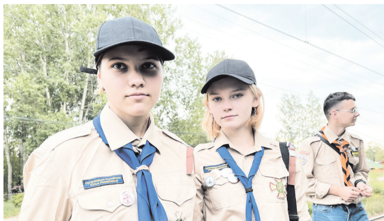
Молодёжь Ленобласти изучает историю страны и безопасный туризм

Новый проект центра направлен на профилактику эмоционального выгорания среди людей «помогающих профессий». Средства гранта губернатора пойдут на оплату труда специа-