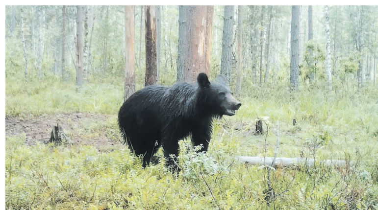
В Ленобласти проживает свыше 3 тысяч бурых медведей