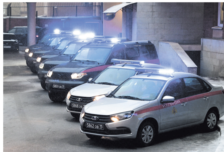
В декабре Ленинградская область передала Росгвардии новые служебные автомобили

ЕКАТЕРИНА ДЗЮБА, АЛЕКСАНДРА РОДИОНОВА