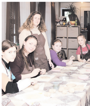
Урок по лепке из глины

— В рамках проекта для учителей, воспитателей, врачей, социальных работников на регулярной основе будут проходить мастер-классы по арт-терапии: занятия по ручной лепке из глины, рисование, шитьё, вязание. Участие в данных встречах позволит повысить свой уровень психологической защищенно-