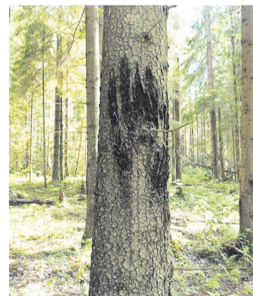
След от лапы медведя на дереве

Если вы неожиданно встретились с медведем, ни в коем случае нельзя от него убегать! Это может побудить хищника к нападению. Медведь плохо видит. Чтобы понять, кто перед ним, животное использует обоняние: встает на задние лапы и вдыхает воздух. Осознав, что перед ним человек, медведь чаще всего опускается на четыре лапы