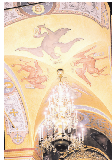
Внутреннее убранство одного из храмов монастыря

Но причём здесь Фиваида? Дело в том, что на заре утверждения христианства состоялся «великий исход» отшельников в египетскую пустыню, где постепенно сложилась своего рода зона расселения святых от-