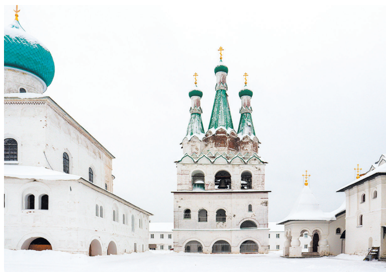
Александро-Свирский монастырь известен памятниками архитектуры XVI века