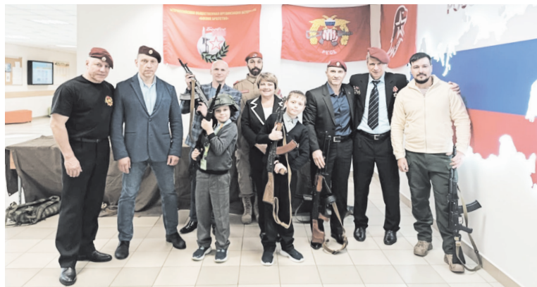
Команда «Боевого братства» проводит уроки мужества в школах Ленобласти

— Нам удалось собрать более 5 тыс. подарков. Это стало не просто региональной акцией, а все-