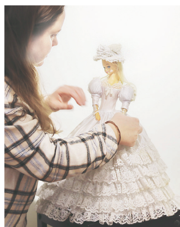
Кукла невеста с маминими волосами