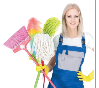
График работы на выбор. Сменный 2/2 режим работы с 8.00 до 20.00; с понедельника по пятницу с 8.00 до 17.00, суббота и воскресенье – выходные. Стабильная заработная плата. Выплаты дважды в месяц. Обращаться по телефонам: 8 919 982 48 97; 8 927 511 50 10