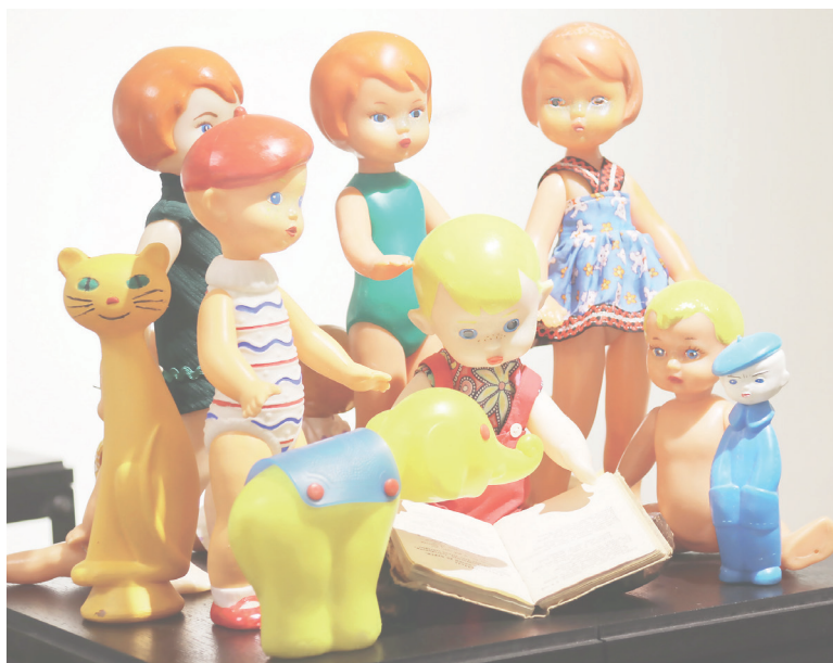
Куклы фабрики «Ленингрушка»