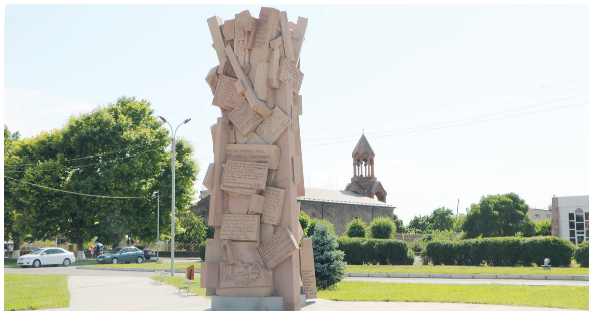
Памятник воздвигнут в 2008 г. в честь подвигов участников Арцахской войны. Скульптор С. Мовсисян