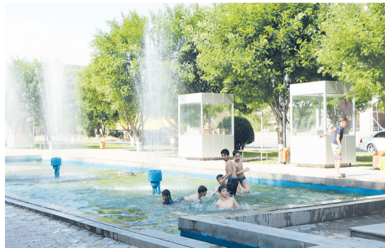
Малышня спасалась в фонтанах

«Что это? Письма? Страницы книги?» - размышляла я,