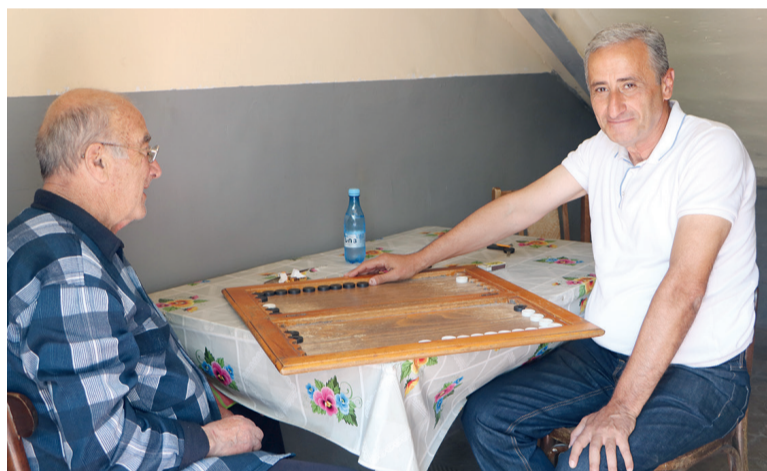
Нарды в Армении - самая популярная игра