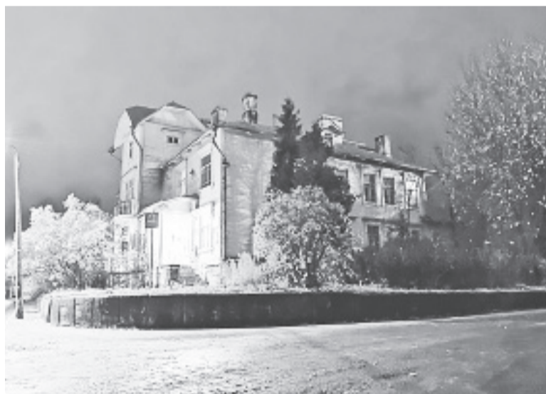
Место самой большой языческой сопки.

Так что о многих событиях мог бы поведать нам это курган, но, увы, он не сохранился. Его размеры и величие (10,5 м высоты, диаметр около 100 м) сослужили ему плохую службу. В 1884 году историк Николай Ефимович Бранденбург начал раскопки этого уникального языческого памятника, предполагая, что это могила Вещего Олега. Однако найденные предметы