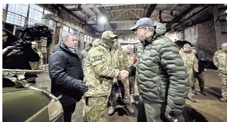
Ремонтный батальон получил необходимое оснащение от Ленинградской области