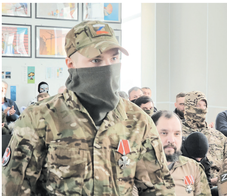
Ветераны-выпускники курсов обучения по специальности «Оператор БПЛА»

АЛЕКСЕЙ АСТАПЧИК ФОТО: АЛЕКСЕЙ АСТАПЧИК, ФИЛИАЛ ФОНДА «ЗАЩИТНИКИ ОТЕЧЕСТВА» В ЛЕНИНГРАДСКОЙ ОБЛАСТИ