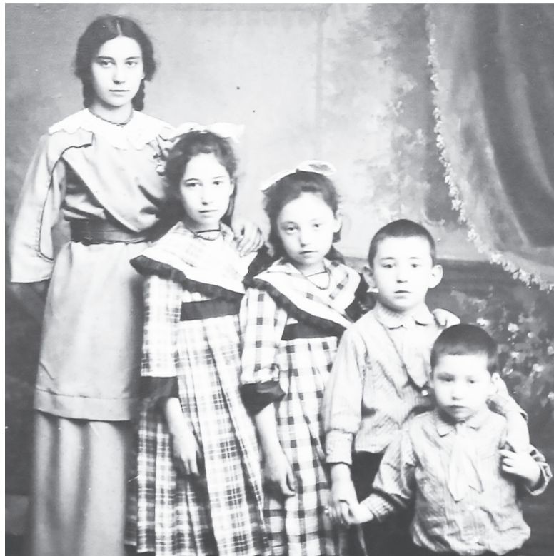
Дети. Фото начала 1910-х гг.