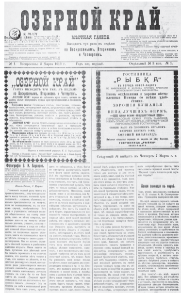
Первый номер газеты «Озерной край» 3 марта 1913 г.

Разрешение на издание было получено, но выход первого номера газеты задержался на 5,5 месяцев. Почему? Возможной причиной та-