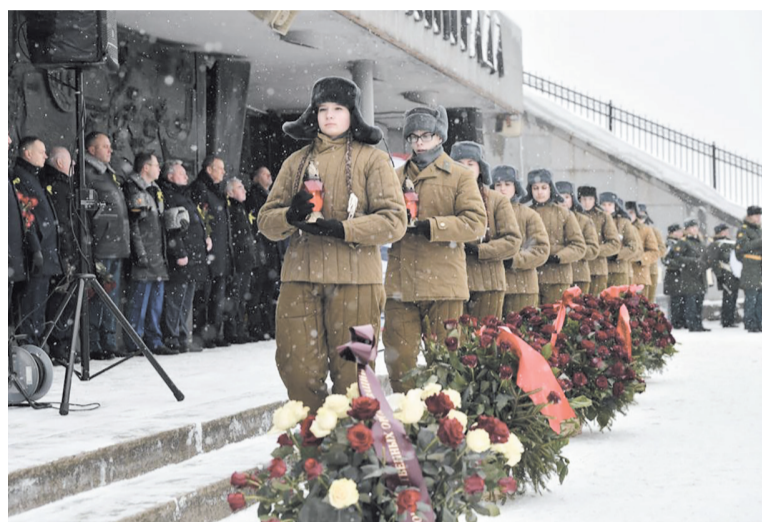
Участники церемонии почтили память павших в годы блокады минутой молчания

Мероприятие началось с концертного номера «Гранитный Ленинград» в исполнении музыкального альянса «Петербургские баритоны» с участием ансамбля танца «Фейерверк». Сразу после вокального номера и звуков Гимна Российской Федерации со словами поздравления к собравшимся обратился Губернатор Ленинградской области.