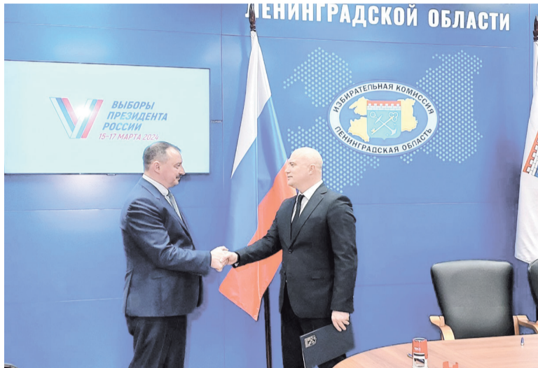
Леноблизбирком и «Почта России» заключили соглашение о сотрудничестве

Менее двух месяцев остаётся до трёхдневного голосования на президентских выборах 2024 года. Мы узнали у Избирательной комиссии Ленинградской области, как регион готовится к этому событию.