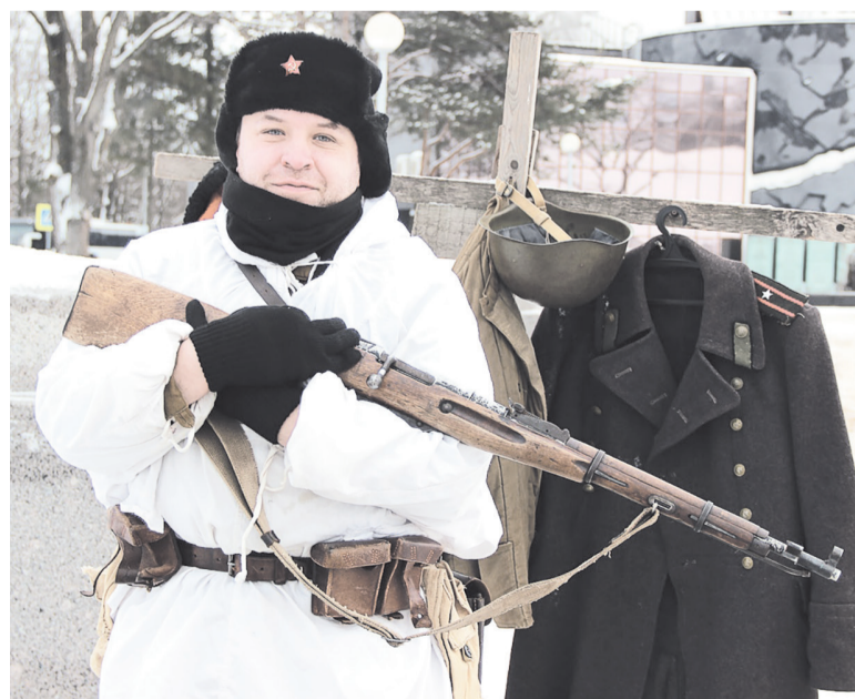
Гостей музея учили обращению с оружием времён Великой Отечественной войны

ЮЛИЯ ТЕТАРСКАЯ