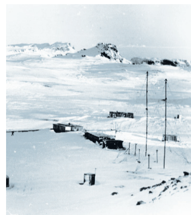
Станция «Беллинсгаузен» в Антарктиде