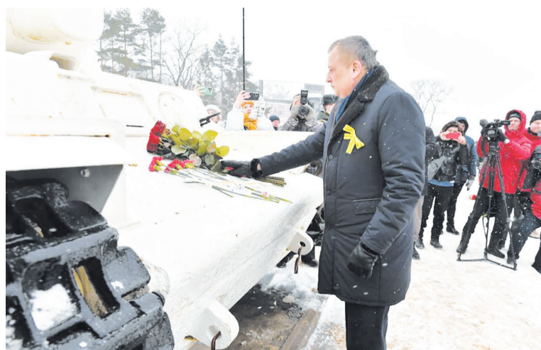
Александр Дрозденко возложил цветы к монументу «Белый танк»