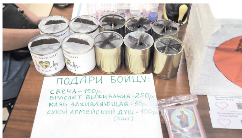
Благотворительная ярмарка в поддержку защитников Отечества в п. Новоселье

— Очень активна команда женсовета Всеволожского рай-