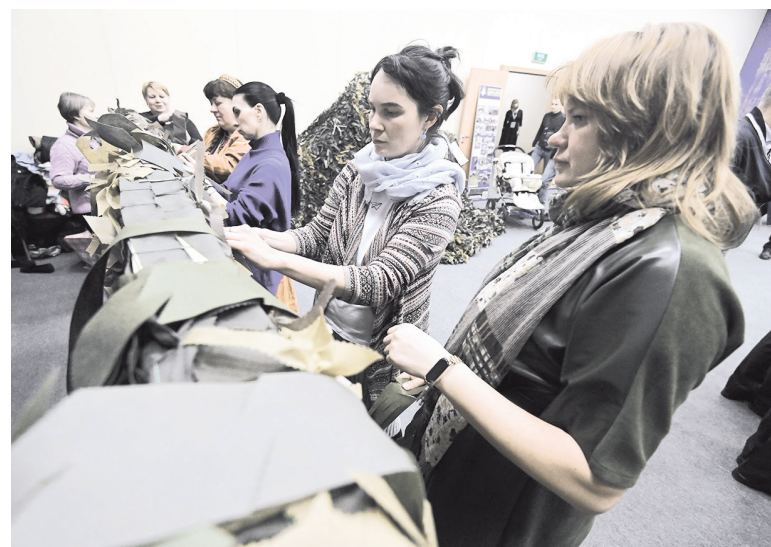
Женщины на мастер-классе по изготовлению маскировочных сетей