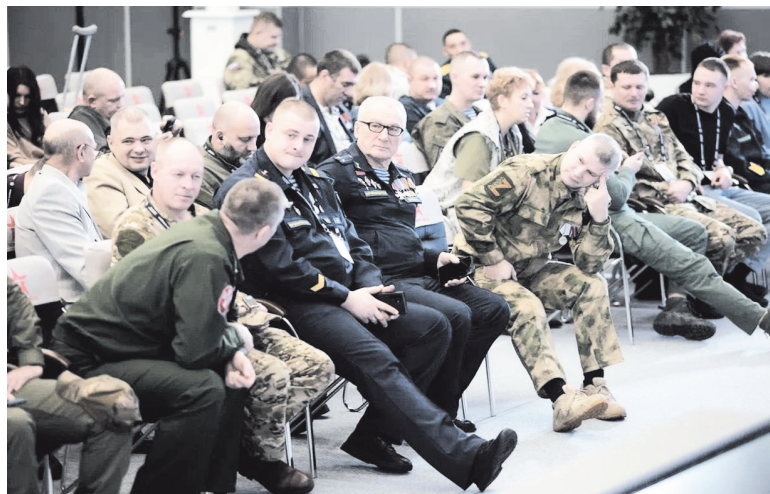
Участники Ассоциации ветеранов специальной военной операции Ленинградской области

ОБЩЕСТВЕННЫЕ ОРГАНИЗАЦИИ ЛЕНИНГРАДСКОЙ ОБЛАСТИ ПОДДЕРЖИВАЮТ УЧАСТНИКОВ СПЕЦОПЕРАЦИИ И ИХ СЕМЬИ