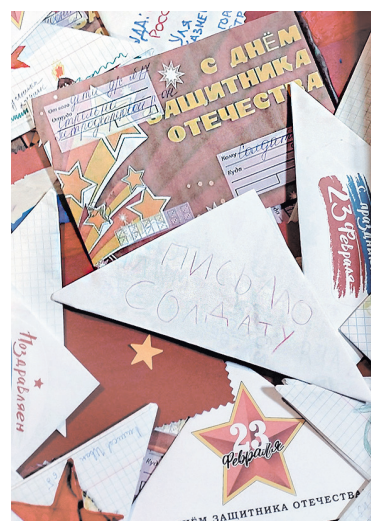
Письма бойцам от детей Ленобласти

АЛЕКСАНДРА РОДИОНОВА